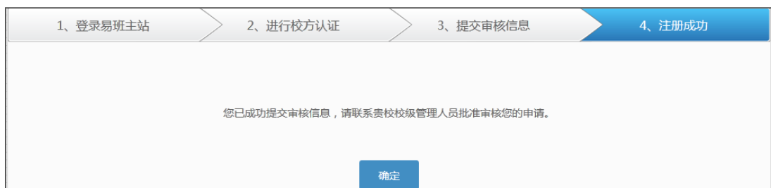
图 6：提交审核信息成功