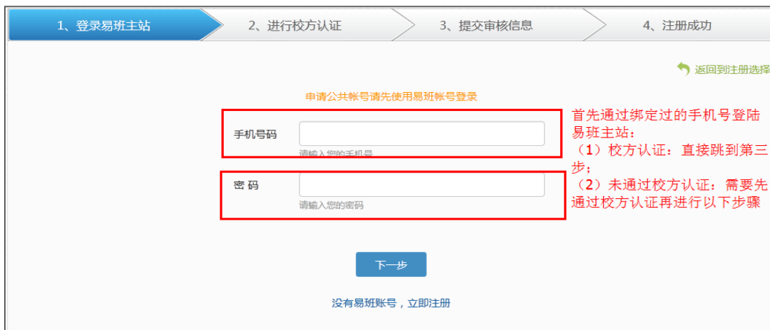
图 3-2：公共账号申请界面