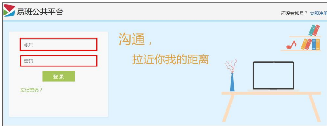
图 7：公共账号登录入口