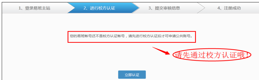
图 4：未通过校方认证