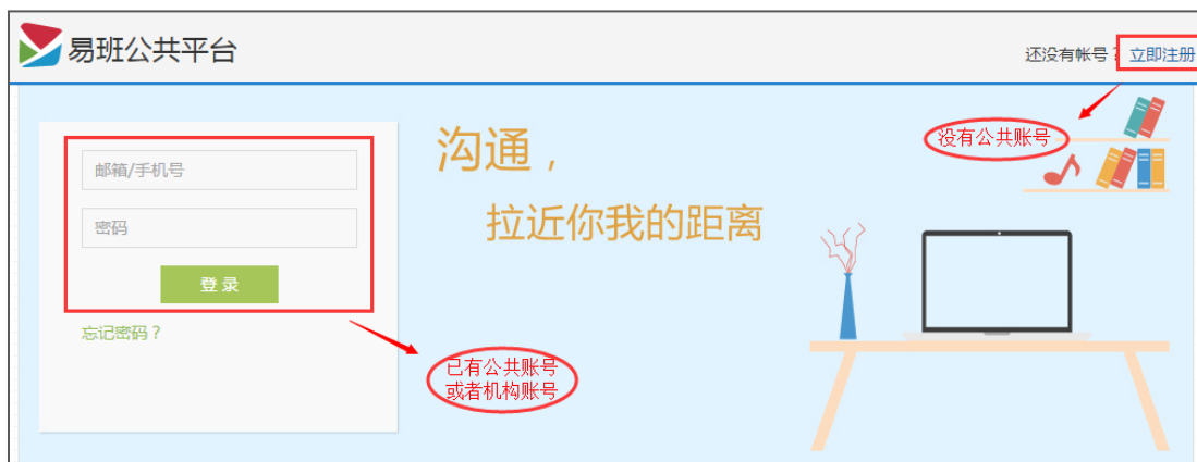
图 1：公共平台登录界面